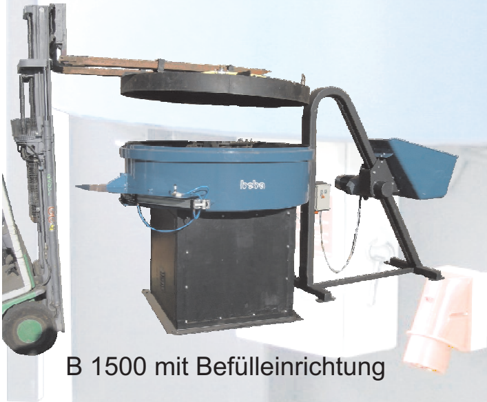
B 1500 mit Befülleinrichtung