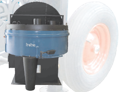
B 1500 mit Staubabdeckung, elektrischen Auslass und verlängerten Auslassstutzen