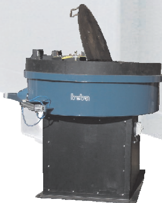
B 1500 mit Staubabdeckung, pneumatischen Auslass und Reinigungseinheit